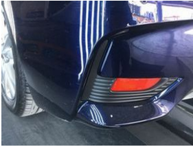
Tampon, arka Arka tampon > Çizik