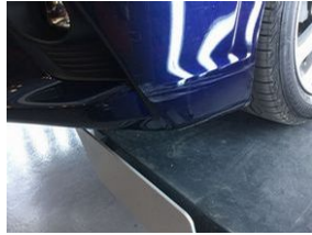
Tampon, ön Ön tampon > Çizik